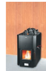
P-11620 RVGL P-12025 RVGL