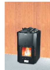
P-116 MGL P-120 MGL