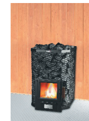
S-116 GL S-120 GL